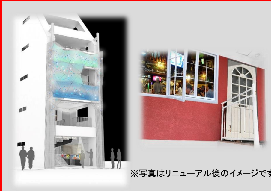
※写真はリニューアル後のイメージです

不動産総合コンサルタント 貸ビル・不動産仲介 宅地建物取引業 東京都知事(15)第12801号