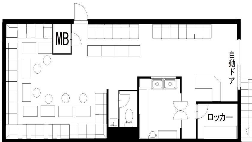
※図面と現況が異なる場合、現況を優先いたします。