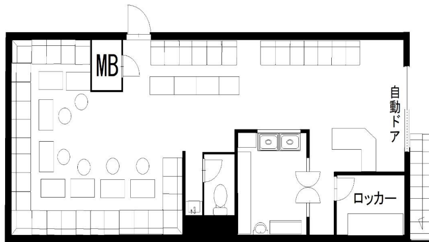
※図面と現況が異なる場合、現況を優先いたします。